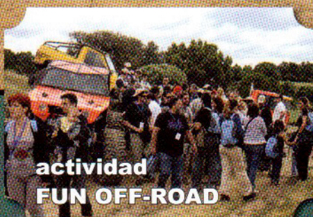
actividad FUN OFF-ROAD