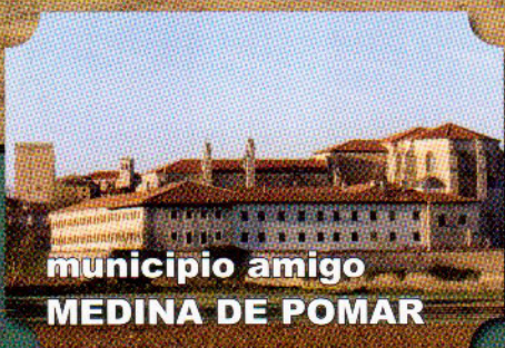
municipio amigo MEDINA DE POMAR