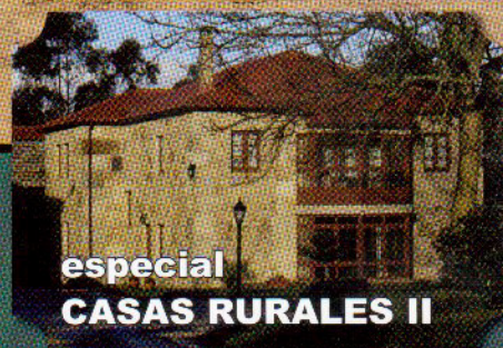
especial CASAS RURALES II